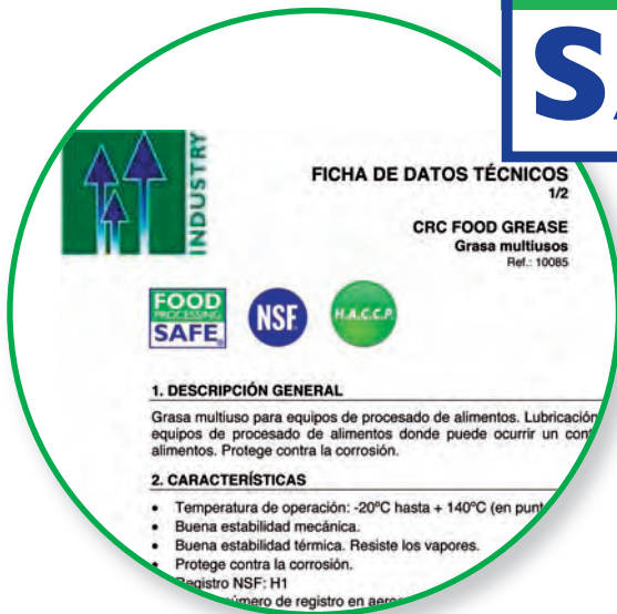
Ficha de datos técnicos