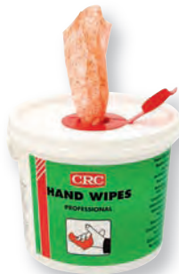
TOALLITAS Toallitas limpiadoras