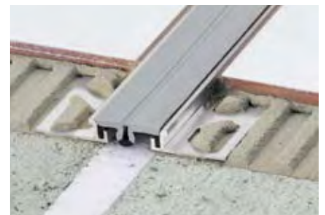
Schlüter®-DILEX-EKSBT 20 V4A