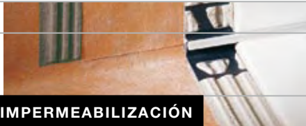
LÁMINA DE IMPERMEABILIZACIÓN