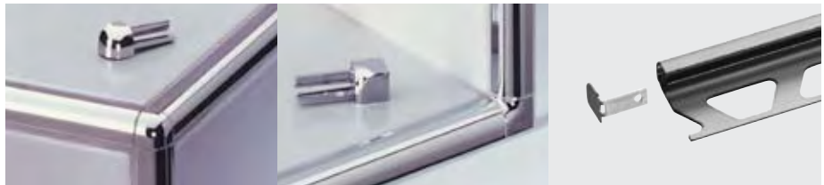
Schlüter®-RONDEC Esquinas exteriores e interiores

(Empalme para perfiles de acero inoxidable)