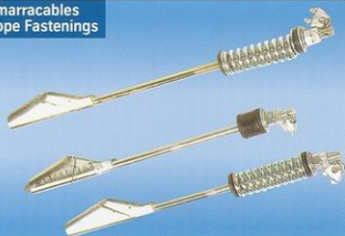
Amarracables Rope Fastenings