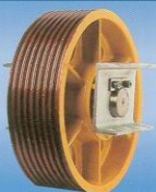
Polea de Desvío TH-20 Diverting Pulley TH-20