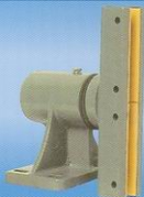
Rozadera T-18 Heavy Duty Sliding Shoe T-18