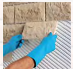
Ejemplo de colocación de elementos decorativos de conglomerado aligerado en ambientes exteriores