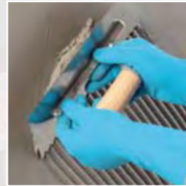
Aplicación de Fix & Grout Brick en diagonal con llana dentada n.10