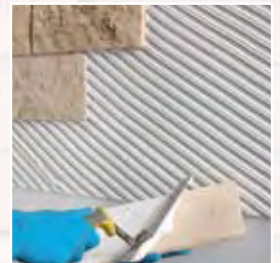
Aplicación del adhesivo sobre el reverso de los elementos decorativos