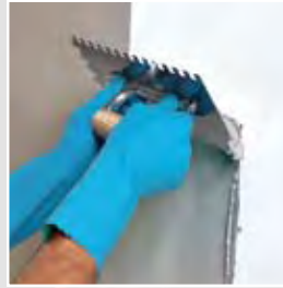
Aplicación de Fix & Grout Brick gris sobre el soporte

El adhesivo que queda en las juntas, acabado con un pincel húmedo antes de que transcurran 20 minutos, realiza la función de rejuntado.