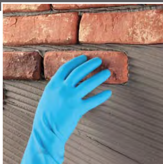
Fase de aplicación

Adhesivo en pasta, listo al uso, para el encolado en interior y exterior de listeles de terracota y elementos decorativos de conglomerado cementoso aligerado y de resina sintética.