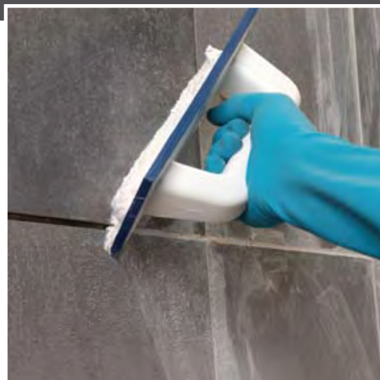
Fase de aplicación