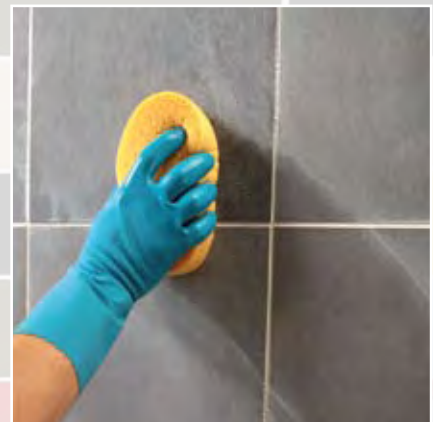
Acabado de la superficie con esponja dura de celulosa