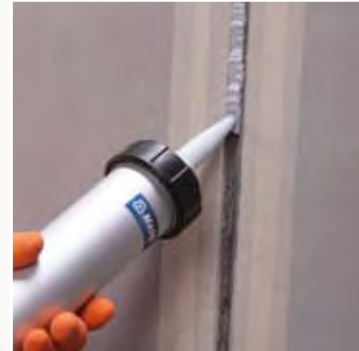
Aplicación de Mapeflex PU40