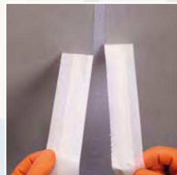
Retirado de las cintas de carroceros, colocadas con anterioridad para delimitar la zona de aplicación

• Presentación: cajas de 20 piezas (salchichones de 600 ml)