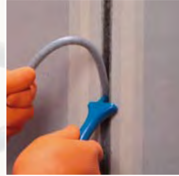
Inserción de Mapefoam en el interior de la junta