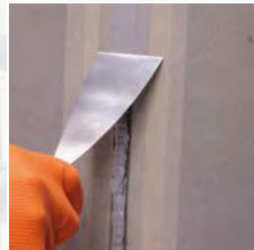
Alisado de Mapeflex PU40