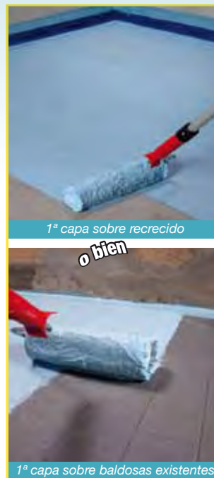
1ª capa sobre recrecido