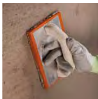
Fratasado del producto