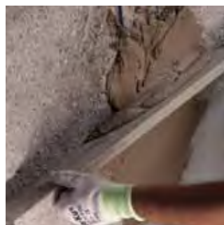
Regleado del producto