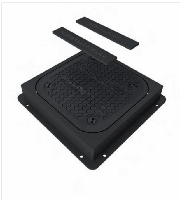
ARQUETA 300 x 300 mm. Regletas con rótulos personalizados.