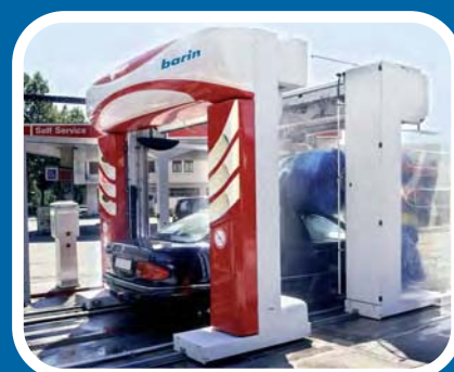
Puentes Dobles Serie Challenge