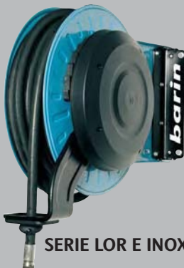
SERIE LOR E INOX