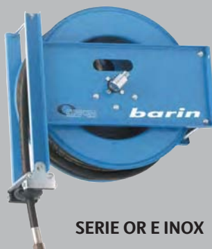
SERIE OR E INOX