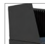
Paneles laterales articulados