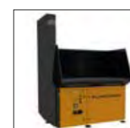
Silenciador/ Conducto de salida