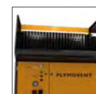
Lámpara de trabajo