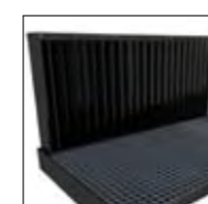
Juego para aspiración trasera