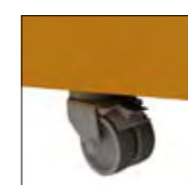
Juego de ruedas