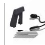
Arranque / paro automático.

DraftMax incluye dos filtros ovalados. La opción de esta forma permite tener la máxima superficie de filtración posible. Además, la mesa de aspiración descendente incluye un innovador sistema de retención de chispas en tres etapas, para una óptima seguridad.