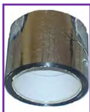
Cinta para solapes