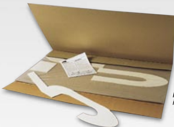
PREMARK® está empaquetado individualmente y listo para usar.

PREMARK® está fabricado con un material termoplástico que se derite con la capa de asfalto cuando se le aplica calor. PREMARK® dura entre seis y ocho veces más que las pinturas de tráfico actuales.