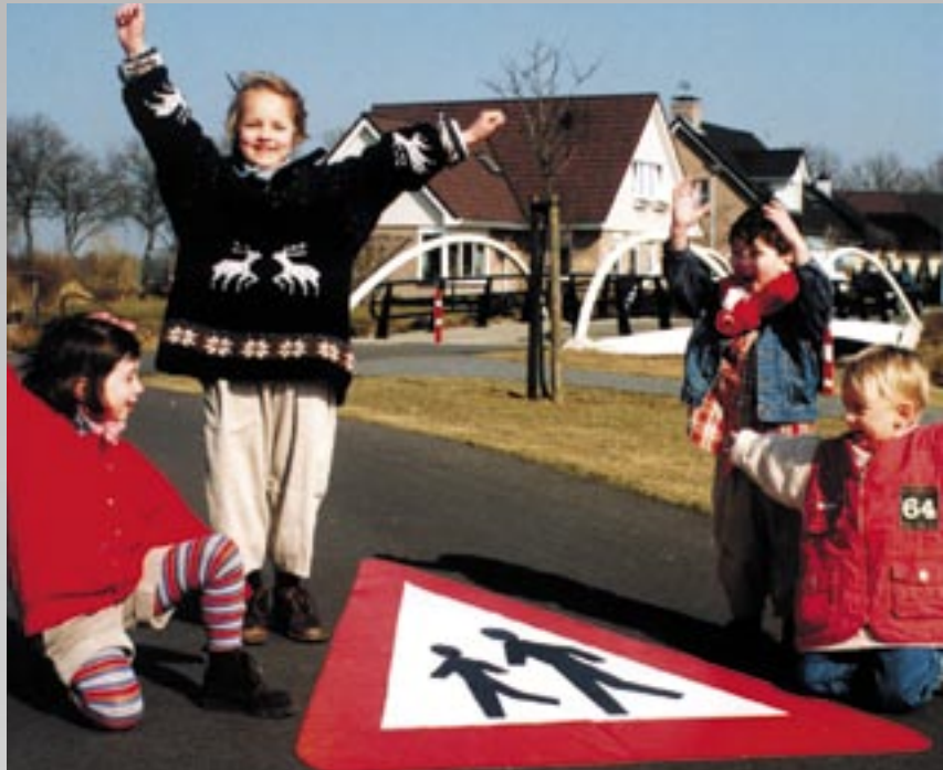
Una señalización bien pensada y duradera es una garantía para la seguridad del tráfico.

PREMARK® es el único tipo de señalización de asfalto que no depende de la temperatura de la carretera, por esto puede ser instalado en cualquier época del año. La única condición a tener en cuenta es que la carretera esté seca, lo cual es siempre posible utilizando el soplete como secador, así no tiene que esperar 24 horas después de una lluvia o nevada.