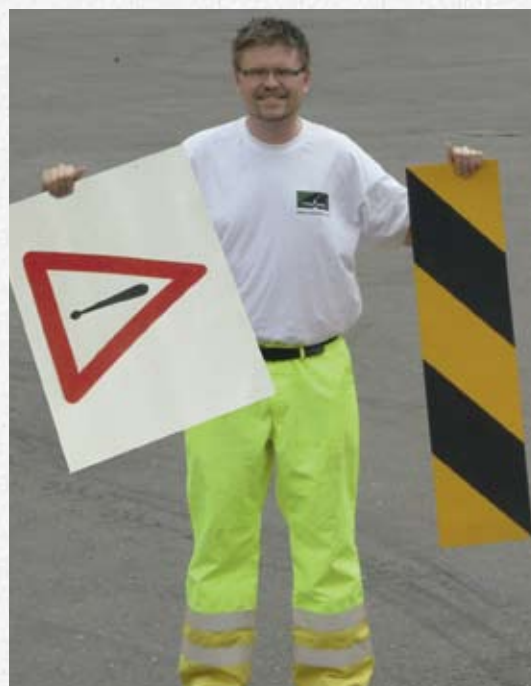
Esto es un Ejemplo de PREMARK® Easy