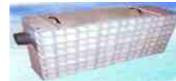
Equipo separador de aceites montado en una cuba de polipropileno

En función de las distintas necesidades, pueden realizarse equipos que incluyan decantadores previos, depósitos de recogida de aceites, etc.