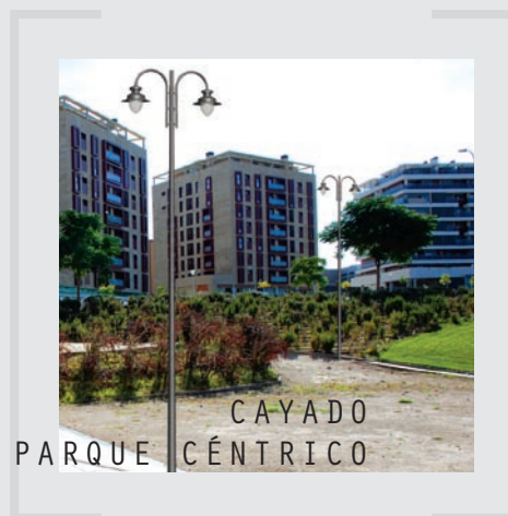
EN PARQUE CAYADO CÉNTRICO

Estas son las luminarias recomendadas por Socelec, aunque dispone de la máxima libertad de elección, gracias a nuestro amplio catálogo de productos con las mejores prestaciones fotométricas del mercado.