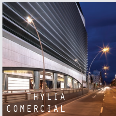
EN ZONA THYLIA COMERCIAL

Estas son las luminarias recomendadas por Socelec, aunque dispone de la máxima libertad de elección, gracias a nuestro amplio catálogo de productos con las mejores prestaciones fotométricas del mercado.