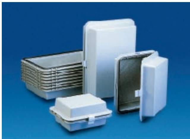
Los cofres de aluminio inyectado SY: existen tres modelos diferentes.

Las cajas SY - diseñadas para incorporar auxiliares eléctricos - están constituidas por dos elementos idénticos, de aluminio inyectado protegido por pintura polimerizada. Los dos elementos están sujetos por dos bisagras de acero inoxidable y un cierre metálico. El sentido de apertura de la caja es intercambiable. Una junta de neopreno mantiene la hermeticidad de la caja. Los componentes están montados sobre chapa o sobre carriles perfilados.