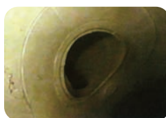
Resultado de este sistema