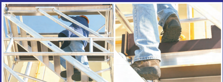
Gran trampilla en última plataforma y acceso