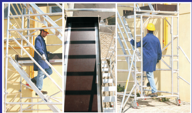
Escalera, plataforma intermedia y acceso comfortable TEMPO COMFORT metros 2.00x1.35x7.62