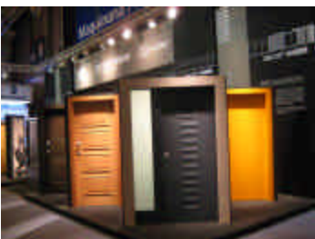
Imagen Feria Veteco Madrid

Desde el año 2004, Acoraval , empresa de nuestro grupo está fabricando y comercializando con notable éxito la Puerta de Alta Seguridad Acorazada para instalar en interior y exterior.