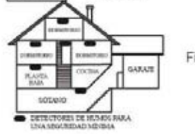
Figura 3: INSTALACIÓN DE LOS DETECTORES DE HUMOS EN RESIDENCIAS DE MÁS DE UNA PLANTA.