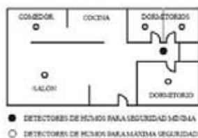
Figura 1: INSTALACIÓN DE LOS DETECTORES DE HUMOS EN VIVIENDAS UNIFAMILIARES CON UNA SOLA ZONA DE DORMITORIOS.